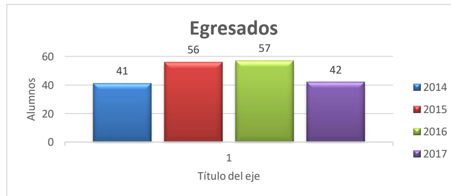
Gráfica 3. Número de Alumnos egresados

En la Gráfica 3 podemos identificar que a pesar de que en la última generación solamente egresaron 42 alumnos, es la eficiencia terminal con mayor porcentaje.